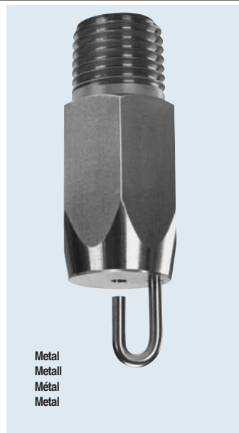
Metal Metall Métal Metal